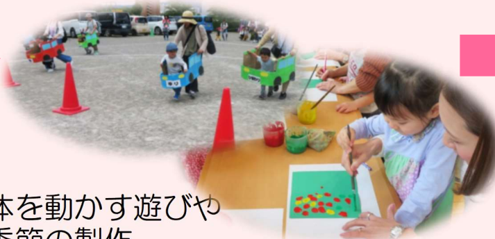
体を動かす遊びや 季節の製作